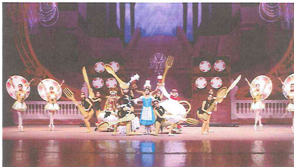
Interpretando roles Asignados en la obra "La Bella y la Bestia"