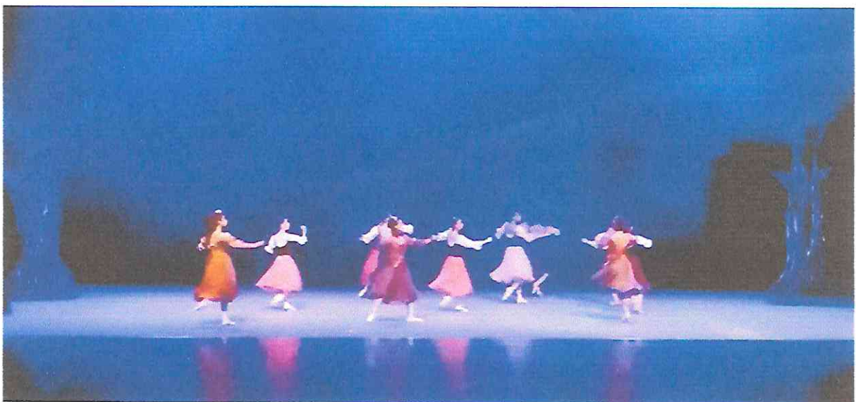
Participación artística como Bailarina de Conjunto, en la obra "La Bella y la Bestia"