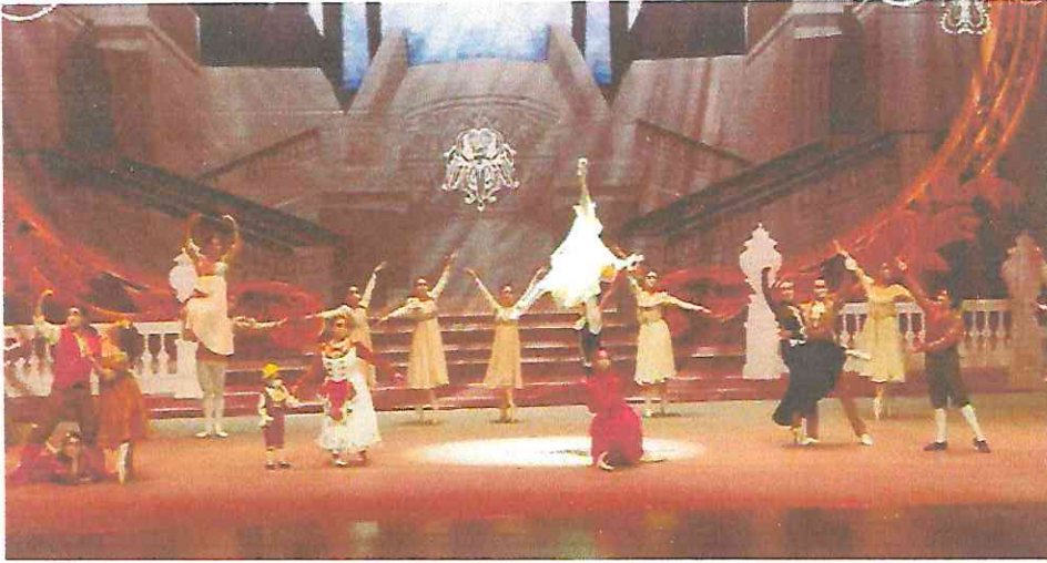
Interpretando los roles asignados en la obra "La Bella y la Bestia"