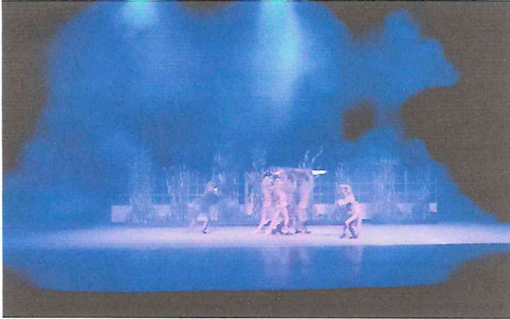
Temporada Infantil 2022 Obra "La Bella y la Bestia"