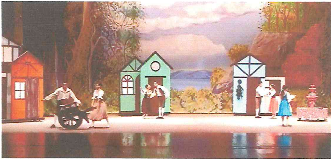
Interpretando los roles asignados como bailarina de conjunto en la obra "La Bella y la Bestia"