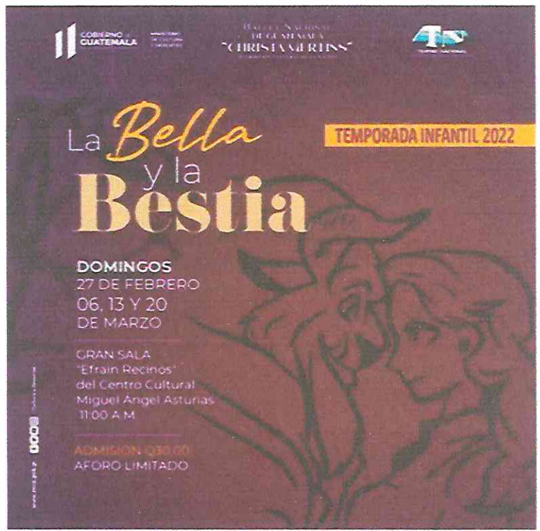
Afiche Publicitario de la obra "La Bella y la Bestia" presentada en el Centro Cultural Miguel Ángel Asturias