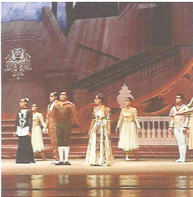
En la obra "La Bella y la Bestia" interpretando los roles asignados como bailarina de conjunto